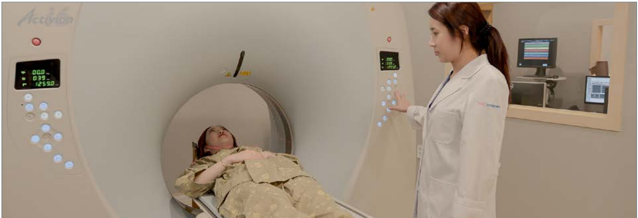
영상의학센터 대학병원급 MDCT, 고성능 초음파를 도입하였으며 영상의학전문가가 직접 판독합니다.