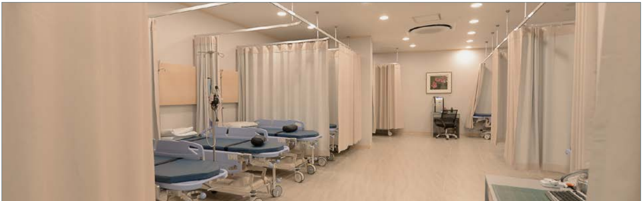
내시경센터 내시경 시술을 하는 전 의료진은 소화기내과 전문의로 구성되어 있으며, 대장내시경 검사당일 용종발견 시 용종제거술이 가능합니다.